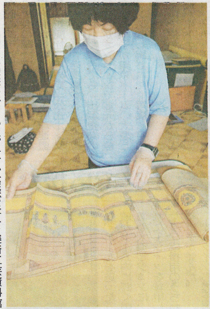
高峰邸の壁画の下絵とみられる装飾画。内部写真にも見て取れる菩薩の姿が描かれている