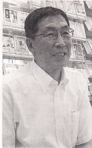
51年生まれ。札幌市内で「くすみ書房」と古本を読みながらコーヒーを楽しむ「ソクラテスのカフェ」を展開する本屋商のオヤジ。北海道書店商業組合理事長。