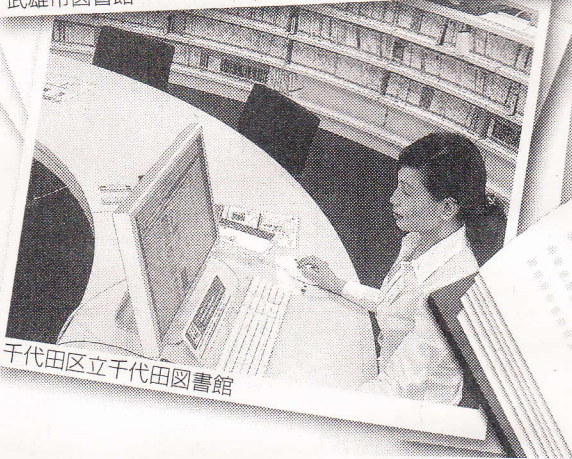
千代田区立千代田図書館