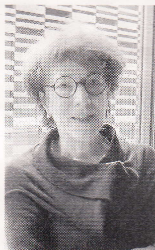
52年生まれ。77～2000年、子どものための図書館をベネチアに開館して、館長を務める。以来、イタリア各地で新しい図書館の企画運営に携わる。邦訳書に「知の広場」