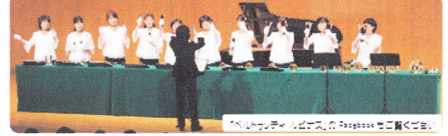
「ベルトウツティ ルピナス」の Facebook をご覧ください。

出演：ベルトウツティ ルピナス 演奏曲：♪Love songs ♪オペラ座の怪人 ♪赤いスイートピー ほか プロフィール：.....2010 年 9 月発足。「ベルトウツティ」には複数の チームがあり、その中でも『ルピナス』は精力的に演奏活動を行っています。 『ルピナス』とは、植物のノボリコシ（異称）のことです。名前の由来は、 どんな土でも成長しているように、という願いが込められています。 私たちは「命を合わせて美しい音色を響かせ、ハンドベルの魅力をもっと多くの人々に知って もらえる」という願いを持って、大阪府を中心に 演奏活動を行っています。 NPO法人日本ハンドベル連盟所属、堺市文化団体連絡協議会所属。