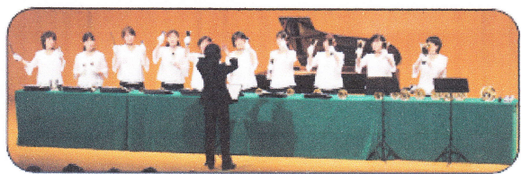
「ベルトウツティ ルピナス」の Facebook をご覧ください。

出演「ベルトウツティ ルピナス」 プロフィール：.....2010 年 9 月発足。 『ベルトウツティ』には複数のチームがあり、その中でも『ルピナス』は精 力的に演奏活動を行っています。 『ルピナス』とは、植物のノボリコシ（異称）のことです。名前の由来は、 どんな土でも成長しているように、という願いが込められています。 私たちは「命を合わせて美しい音色を響かせ、ハンドベルの魅力をもっと多くの人々に知って もらえる」という願いを持って、大阪府を中心に 演奏活動を行っています。 NPO法人日本ハンドベル連盟所属、堺市文化団体連絡協議会所属。