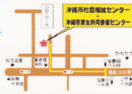
沖縄市男女共同参画センター(沖縄市住吉1-14-29) ※沖縄市社会福祉センターとの複合施設

職場の人間関係を円滑に進めるための 上司・部下・同僚別の 明日から コミュニケーション術