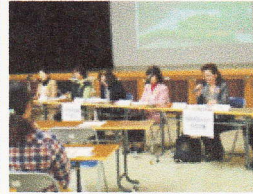
昨年度報告会の様子