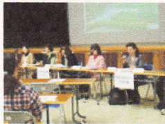
昨年度報告会の様子