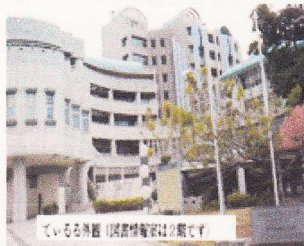
ているる外観 (図書情報室は2階です)