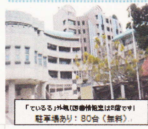
「ているる」外観(図書情報室は2階です) 駐車場あり:80台(無料)

開館日時 朝9時～夜8時まで開いています(火曜日～土曜日)。 ただし、日曜日は午後5時まで。月曜日と毎月第1水曜日は休館。 問い合わせ 電話:098-868-4077