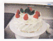
デコレーションケーキ