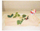
ブッシュドノエル