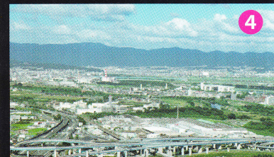
山崎合戦の古戦場が一望のもと 旗立松展望台

山麓コース 約4km・2.5時間 JR山崎・阪急大山崎駅 スタート 大山崎町歴史資料館 ▶ 離宮八幡宮 ▶ 妙喜庵 ▶ 大念寺 ▶ 宝積寺(宝寺) ▶ 青木葉谷展望広場 ▶ 旗立松展望台 ▶ 観音寺(山崎聖天) ▶ アサヒビール大山崎山荘美術館 ゴール JR山崎・阪急大山崎駅