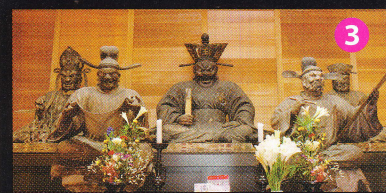
一寸法師伝説の寺 宝積寺(宝寺) 鎌倉時代作・日本一の間魔王像と眷族像は必見。