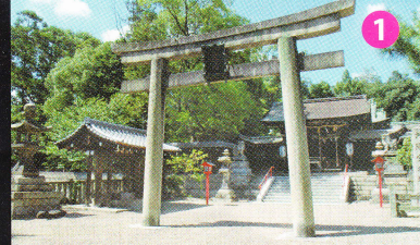
精油発祥の神社。 中世に油座の本所があった 離宮八幡宮 油の神様。油断大敵お守り授与。