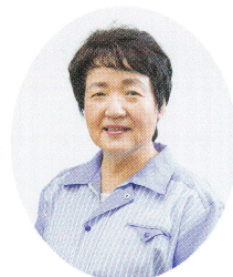
主な公職 (一社)神戸市機械金属工業会会長 (一社)神戸経済同友会副代表幹事 神戸商工会議所女性会会長