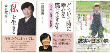
【安倍昭恵さん著書】 左：『私をいきる』（海竜社） 中央：『どういう時に幸せを感じますか？（アッキーのスマイル対談）』（ワック） 右：『安倍昭恵の日本のおいしいものを届けたい 私がUZUを始めた理由』（世界文化社）

1962年東京都生まれ、現役総理大臣夫人・ファーストレディとして多忙な生活を送りが、自分の軸を大切に活動にまい進する姿勢、どんな立場の人でも心の垣根なく交流する気さくな人柄、多くの共感を呼んでいる。その活動は教育、社会福祉、国際交流、復興支援など非常に多岐。自身として農業に力を入れ、安倍晋三氏の地元、山口では無農薬米の栽培や、農業をテーマに大学生とコラボレーションをするなどしている。また東京・神田には無添加無農薬素材をコンセプトにした居酒屋『UZU』を経営。女性の生き方支援にも積極的で、女性の第一歩を応援するセミナー『UZUの学校』校長を務めている。「自分の心に正直に」をモットーにした愛と行動の人。