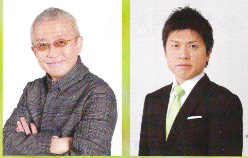
コラムニスト 勝谷誠彦氏