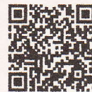
申込専用フォーム