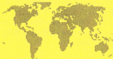
ジェンダー・ギャップ指数(2014) 主要国の順位