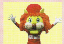
チャリオン 岸和田製輪マスコットキャラクター