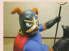
いぬなきん 泉佐野市公認キャラクター