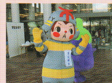
きしぼう 岸和田市消防本部マスコットキャラクター