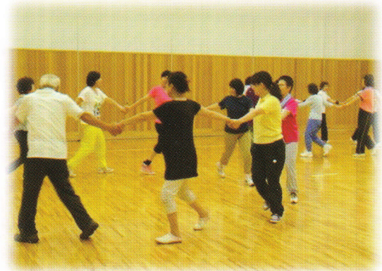
楽しみながら体を動かそう！

主催/大阪府立少年自然の家 住所/大阪府貝塚市木積字秋山長尾 3350 協力/NPO法人元気アップAGEプロジェクト NPO法人みんなのスポーツ協会