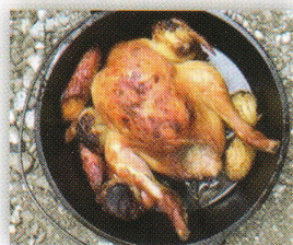
野外料理(ダッチオープン)