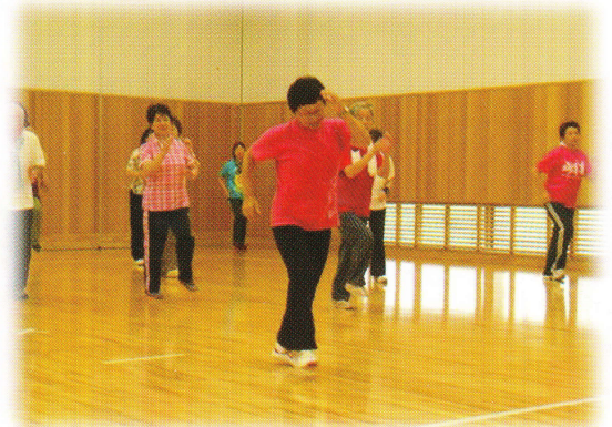
音楽にあわせてステップを踏んでかるやかに！