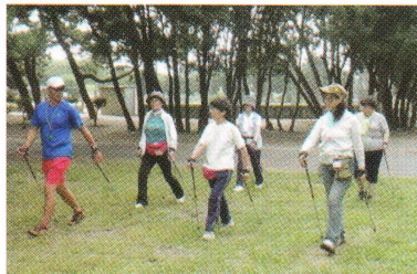
ノルディックウォーキング体験