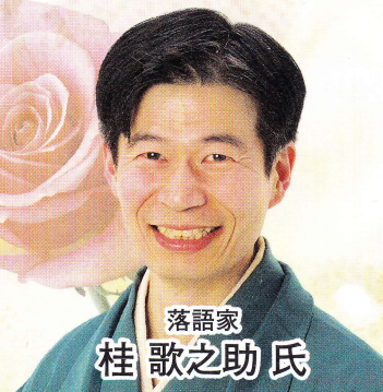
落語家 桂 歌之助氏