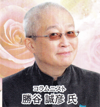
コラムニスト 勝谷 誠彦氏