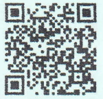
子育て館ホームページ