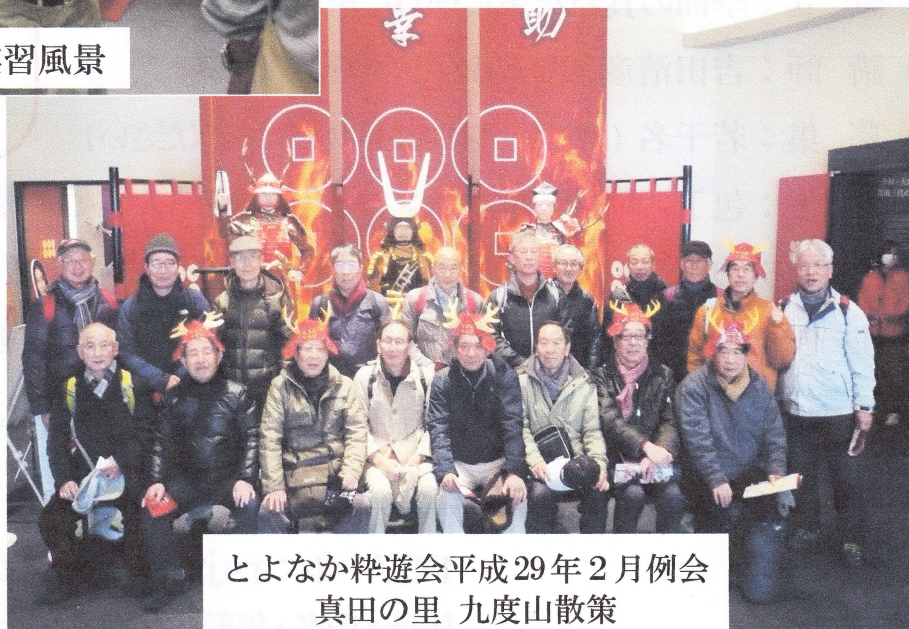
とよなか粋遊会平成29年2月例会 真田の里 九度山散策