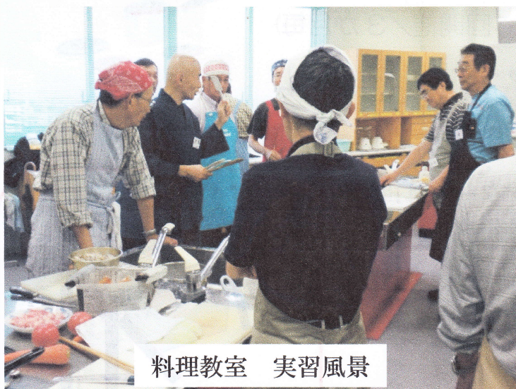
料理教室 実習風景